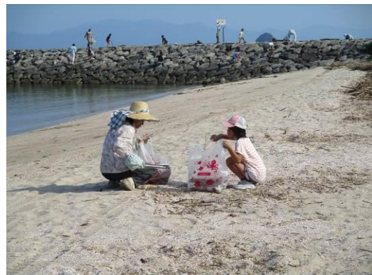
— 昨年度の活動状況（芦北町御立岬公園海水浴場）