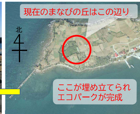
現在のまなびの丘はこの辺り 北 ここが埋め立てられエコパークが完成 かつての明神岬と水俣湾