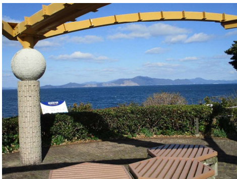
八代海と御所浦島