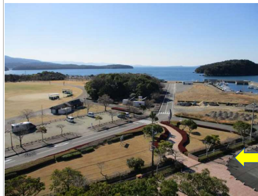
エコパーク (埋立地)